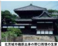
北茨城市磯原出身の野口雨情の生家

誕生；1882年5月29日 茨城県多賀郡磯原町 (現・北茨城市) 死没；1945年1月27日 (62歳没) 職業；童謡作家・詩人 最終学歴；早稲田大学 中退