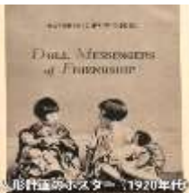
人形伝書紙の表紙(1920年刊)

さて、アメリカから日本に送られた「青い目の人形」は、背丈は一尺五寸、手足は動くようにつなぎ、ママーと声を出す仕掛けで、洗濯のきく美しい服を着ていました。また人形は、アメリカの公私立学校の生徒や、ガールスカウトなどの児童たちが中心となり、親善の手紙を用意し、日本へ赴くためのパスポート、乗船切符、旅券を人形一体一体に準備しました。