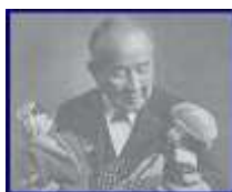
人形を抱く渋沢栄一氏