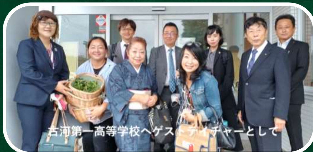
古河第一高等学校へゲストティーチャーとして